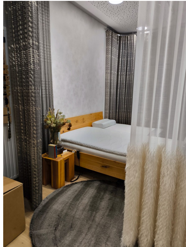
Eindrücke aus dem Laden