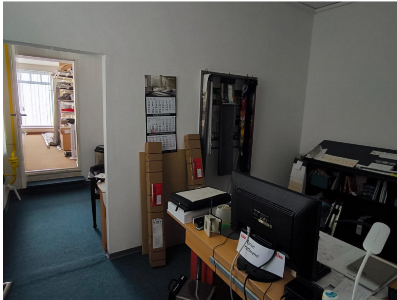
Blick in die Nebenräume