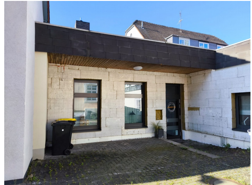
Hinterer Eingang/ Anlieferung mit 1-2 Stellplätzen