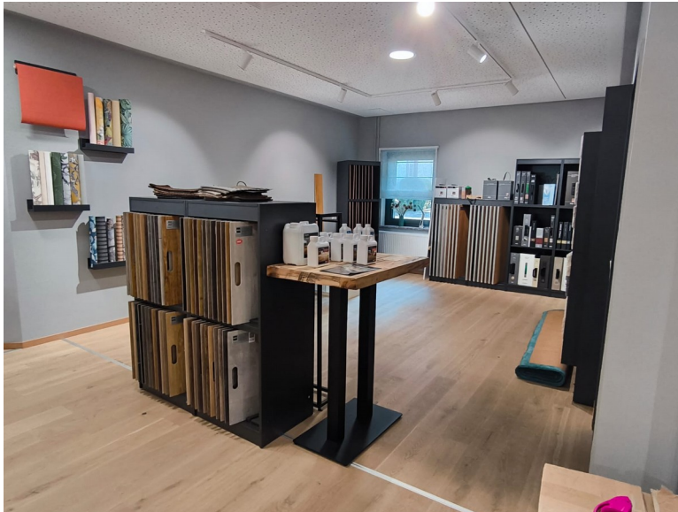
Blick in die renovierte Verkaufsfläche