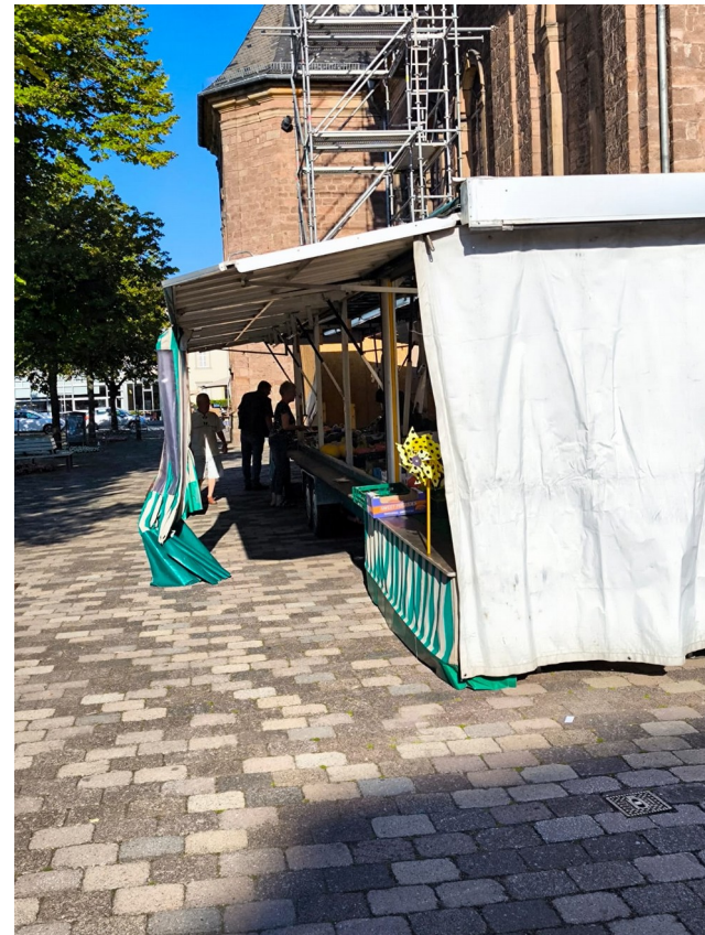
Wochenmarkt gegenüber an der Kirche