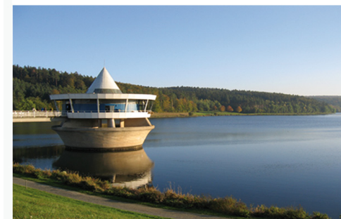
Twistesee, „Café im See“